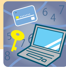
情報セキュリティ 事故