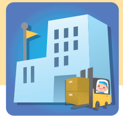
サプライチェーン の途絶