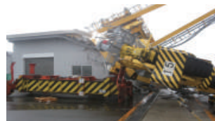
平成30年9月台風21号での大阪港の被害状況

風水害による被害は年々上昇傾向に! 毎年、各地で発生する災害だといえることから事業継続としての備えが必要!