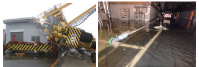
平成30年9月台風21号での大阪港の被害状況

風水害による被害は年々上昇傾向に! 毎年、各地で発生する災害だといえることから事業継続としての備えが必要!