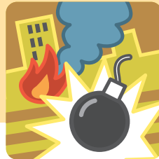
テロ事件 (大規模イベントなど)