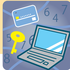
情報セキュリティ 事件・事故