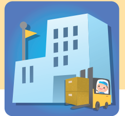
サプライチェーン の途絶